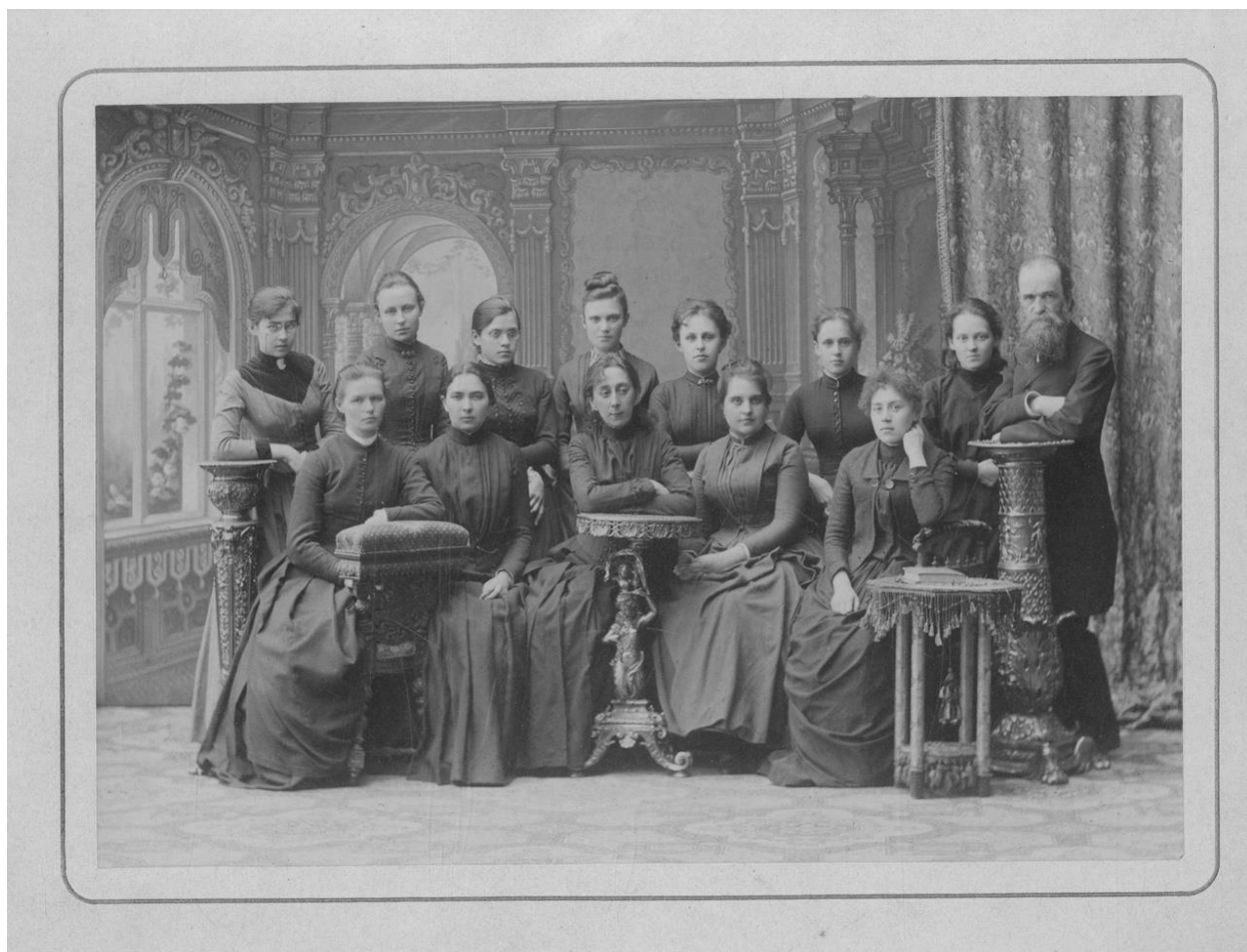
Слушательницы «Домашних курсов» П.Ф. Лесгафта 1870-е годы

подготовке специалистов в области физического образования. В этот период он одновременно работает над созданием основы для своей теории физического образования.